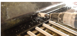
37 mm hole for injector hose